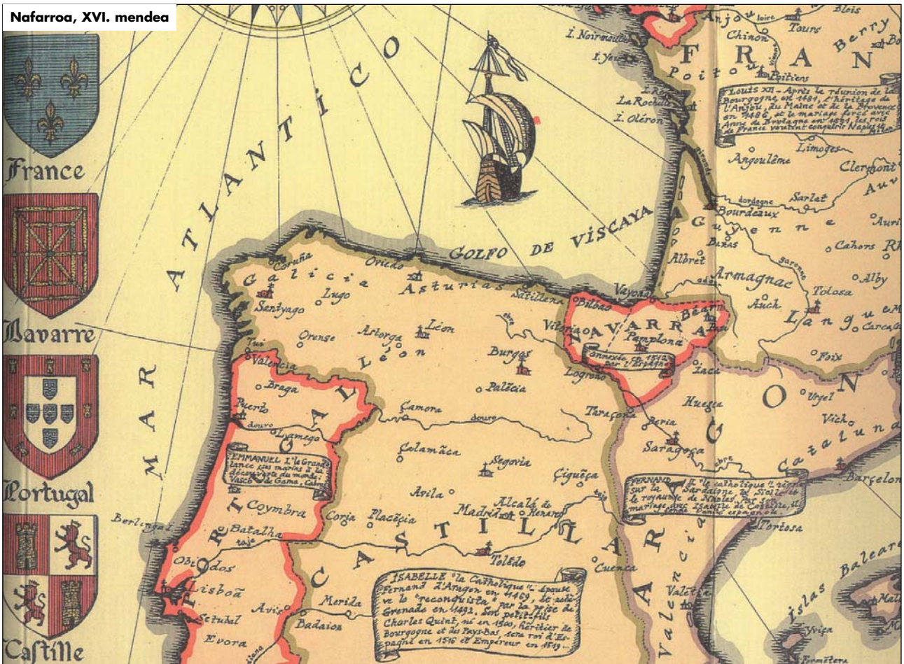
Nafarroa, XVI. mendea